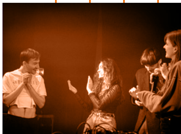
Filippo Nisini © Crous BFC

Seul(e)s les étudiante)s ou les groupes composés pour moitié d'étudiants peuvent s'inscrire au Tremplin Pulsations. Ils doivent également être en capacité de présenter au moins 3 titres originaux.