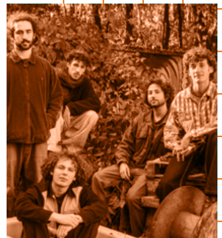
© Anessa Busseret & Maxim Bruchet